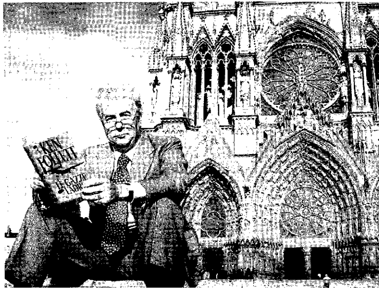
El escritor posa delante de Notre Dame en París, en 2001, con su anterior libro 'Aito riesgo'.