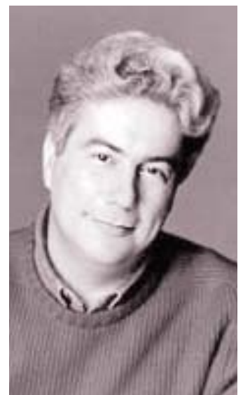
Ein erfolgreicher Romanschriftsteller