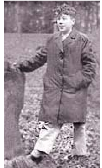
Als Schuljunge in Wales