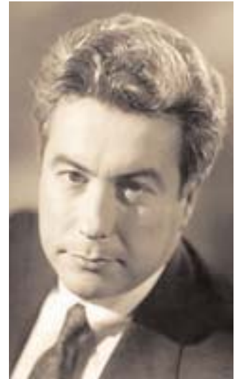
Der erste Bestseller

Und dann überraschte er seine Leser, indem er sein Metier radikal änderte, mit dem Buch Die Säulen der Erde (The Pillars of the Earth - 1989) . Es ist ein Roman über den Bau einer fiktiven Kathedrale im Mittelalter. Dieses Buch erhielt begeisterte Kritiken und führte sechs Jahre lang die deutschen Bestsellerlisten an. In der im Jahr 2004 vom ZDF durchgeführten Umfrage Unsere Besten - Das große Lesen landete Die Säulen der Erde auf Platz 3 der beliebtesten Bücher der Deutschen, gleich nach J.R.R. Tolkiens Der Herr der Ringe und der Bibel .