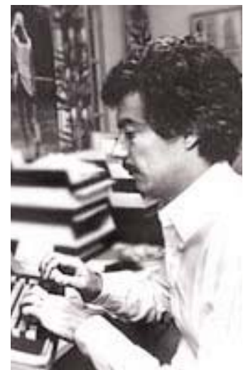
Die rechte Schriftstellerei