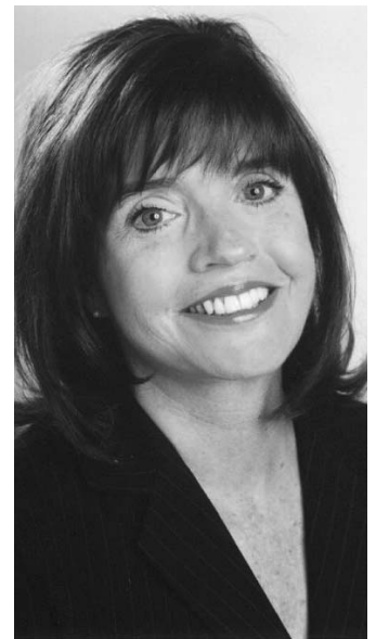
Barbara Follett MP