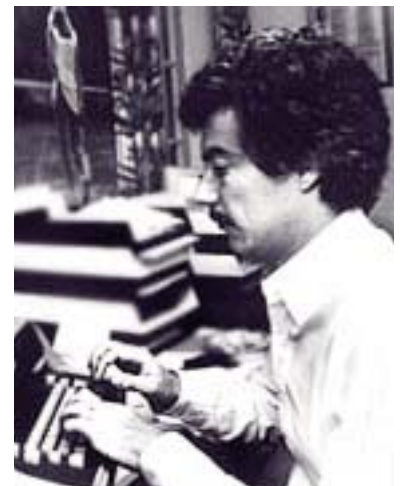
Die rechte Schriftstellerei