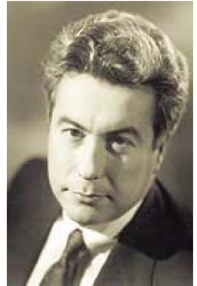
Der erste Bestseller

Die folgenden drei Romane, Nacht über den Wassern ( Night Over Water – 1991), Die Pfeiler der Macht ( A Dangerous Fortune – 1993), und Die Brücken der Freiheit ( A Place Called Freedom – 1995) waren mehr Unterhaltungsromane als Thriller. Mit dem Roman Der dritte Zwilling ( The Third Twin – 1996) kehrte er jedoch wieder zum Thriller-Genre zurück. 1997 stand dieser Roman in der jährlichen Übersicht der internationalen Belletristik-Bestseller in Publishing Trends gleich hinter John Grishams Roman The Partner an zweiter Stelle. Sein nächstes Werk, Die Kinder von