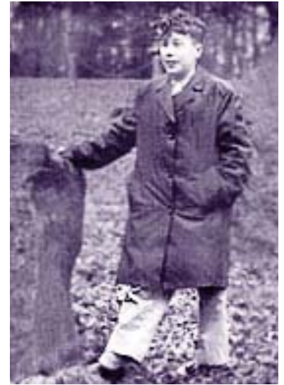
Als Schuljunge in Wales

Seine Feierabend-Schriftstellerei führte zwar zur Veröffentlichung einiger Bücher, aber keines