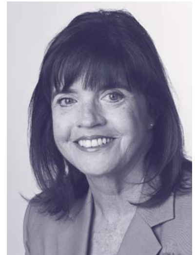
Barbara Follett MP