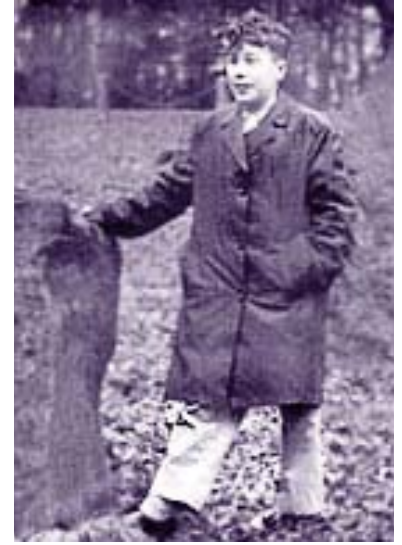
Como escolar en Gales