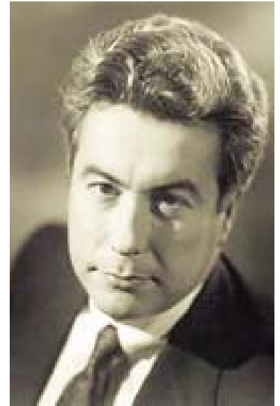
El primer best seller

Ken volvió a la época de la Segunda Guerra Mundial para ambientar sus dos novelas siguientes: Alto riesgo (2001), un thriller sobre un grupo de mujeres lanzadas en paracaídas sobre Francia con la misión de destruir una central telefónica de suma importancia (y que fue galardonado en 2003 con el Premio Corine), y Vuelo final (2002), que trata sobre una intrépida pareja danesa que huye de la Dinamarca ocupada en un biplano Hornet Moth reconstruido que les lleva hasta Gran Bretaña, llevando consigo información trascendental sobre un nuevo sistema de radar alemán.