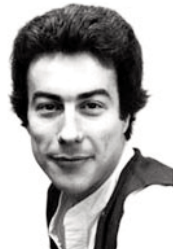
Vida de estudiante...