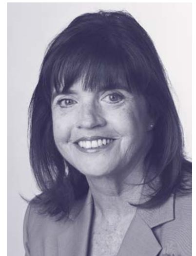
Barbara Follett, representante parlamentaria