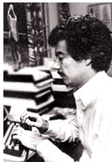
L'écrivain à l'œuvre