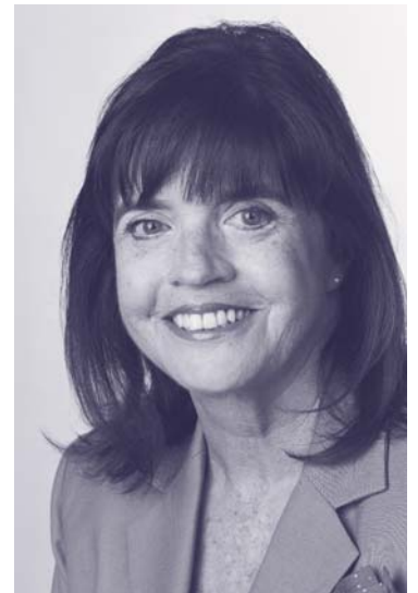
Barbara Follett MP