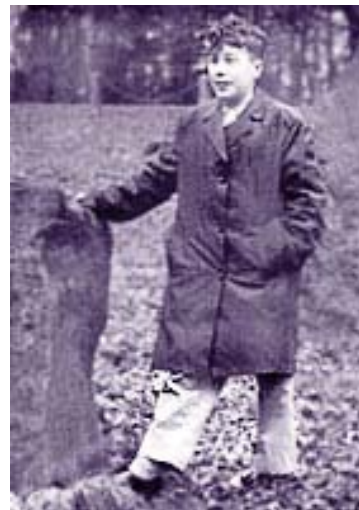
Un écolier au Pays de Galles