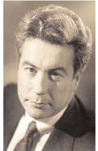
Le premier livre à grand succès

Son œuvre suivante, The Hammer of Eden (1998), est une autre histoire contemporaine à