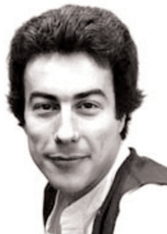
La vie d'étudiant°