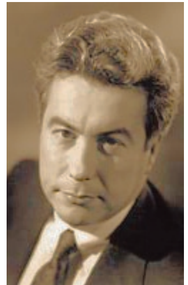
El primer best seller

Luego sorprendió a sus lectores al cambiar radicalmente el rumbo con la novela Los pilares de la tierra (1995), que trata sobre la construcción de una catedral en la Edad Media. Recibió críticas entusiastas y estuvo en la lista de best sellers del New York Times durante dieciocho semanas. También encabezó las listas de best sellers de Canadá, Gran Bretaña e Italia, y se mantuvo en las listas de los libros más vendidos en Alemania durante seis años.