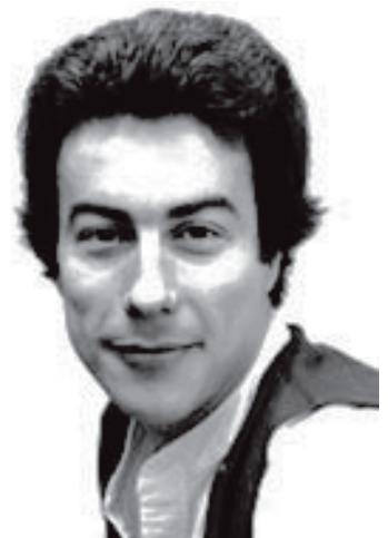
Vida de estudiante...