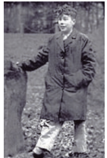
Como escolar en Gales