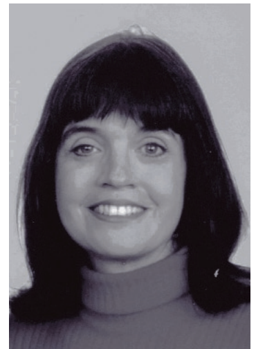
Barbara Follett, representante parlamentaria