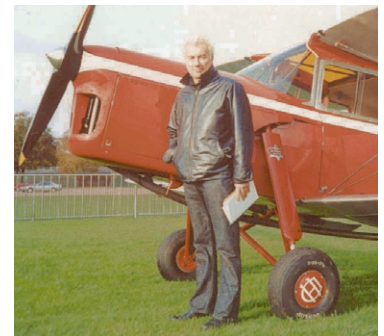
Ken aprendió a volar mientras investigaba para su última novela, Vuelo final