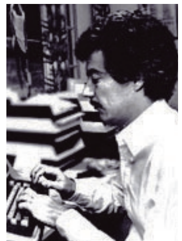
El talento de un escritor