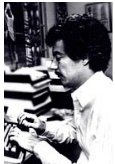
L'écrivain à l'œuvre