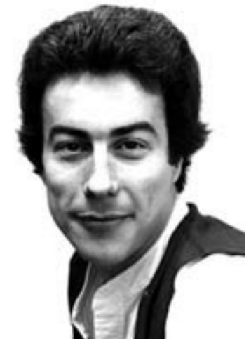
La vie d'étudiant°