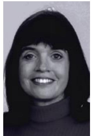
Barbara Follett MP