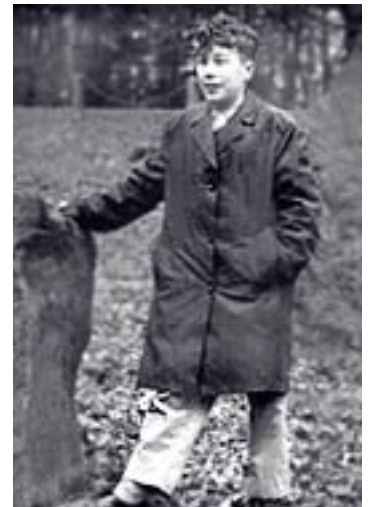
Un écolier au Pays de Galles

Quand il ne réussit pas à atteindre le sommet de « reporter investigateur reconnu » qu'il