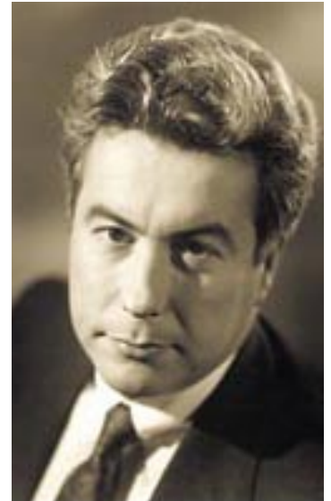
Le premier livre à grand succès

Ensuite il a pris les lecteurs par surprise en changeant radicalement de direction avec son livre intitulé « The Pillars of the Earth » (en 1989), un roman concernant la construction d'une cathédrale au Moyen Âge. Ce livre a reçu des critiques dithyrambiques et est apparu sur la liste de livres à grand succès du New York Times pendant 18 semaines. Il a également été couronné de succès sur les listes au Canada, en Angleterre et en Italie et, en Allemagne, il était sur la liste des grands succès pendant 6 ans.